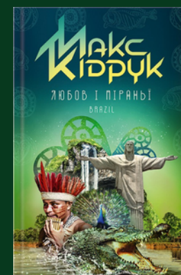
Любов і піраньї : [роман] / Макс Кідрук. – Харків : Клуб Сімейного Дозвілля, 2017. – 288 с. : іл.

Втішки від проблем, покинувши всі непорозуміння та вирушивши у подорож Бразилією, у автора не було ні плану, ні заброньованих квитків. Була лише компанія київських хлопців, які вирішили, що зимова відпустка з фотополюванням на кайманів і піраній у Пантаналу буде більш екзотична, ніж пляжі Єгипту чи лижні траси Буковелю. А найбезлюдніша у світі та все ж повна життям волога саванна вражатиме мандрівників зустрічами з екзотичними мешканцями!