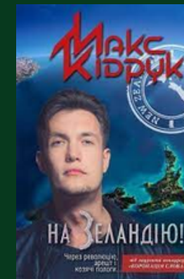
На Зеландію! : [роман] / Макс Кідрук. – Харків : Клуб Сімейного Дозвілля, 2014. – 256 с. : іл.

Сергій Притула вигадав акцію “На Зеландію!” і запропонував відрядити туди Макса Кідрука, який популярно роз’яснить, що Україна – шанована держава.