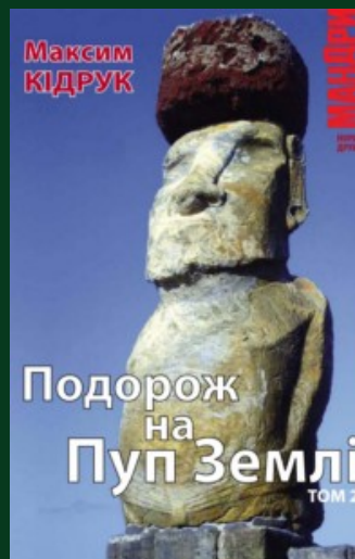
Подорож на Пуп Землі : [роман] / Макс Кідрук. – Київ : Нора-Друк, 2010. – Т. 2. – 224 с. – (Мандри).