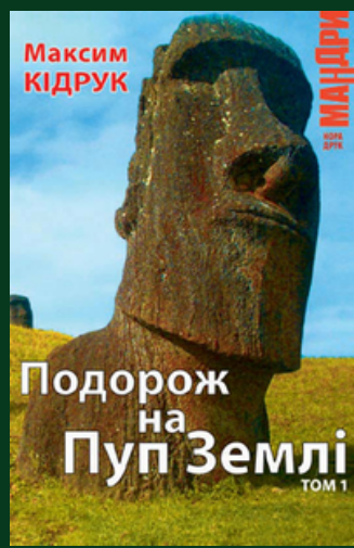
Подорож на Пуп Землі : [роман] / Макс Кідрук. – Київ : Нора-Друк, 2010. – Т. 1. – 224 с. – (Мандри).