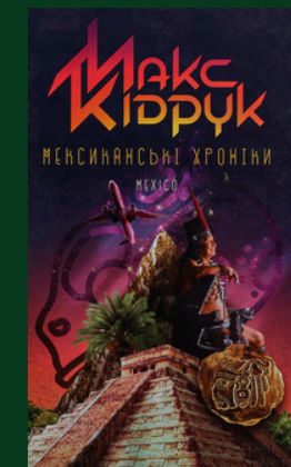
Мексиканські хроніки : [роман] / Макс Кідрук. – Харків : Клуб Сімейного Дозвілля, 2016. – 256 с. : іл.

Роман про мандрівку відомого українського письменника й журналіста Макса Кідрука присвячений його першій подорожі Мексикою від західного до східного узбережжя, яку він здійснив ще аспірантом і яка змінила все його життя. Це здійснення його великої Мрії, зухвалої, яка здавалась нездійсненною, але яка врешті решт, завдяки безладній суміші віри та впертості, втілилась у життя.