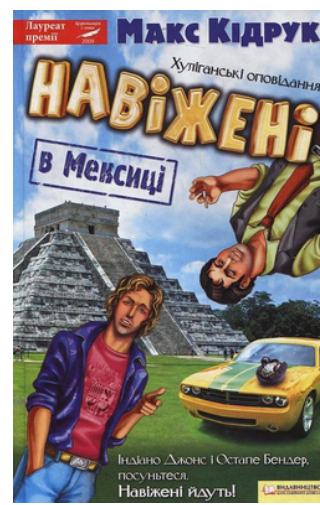
Навіжені в Мексиці : [хулганські оповідання] / Макс Кідрук. – Харків : Клуб Сімейного Дозвілля, 2011. – 286 с. : іл.

Продовження книги “Подорож на Пуп Землі” т. 1, про подорож, пригоди двох друзів-мандрівників на острів Пасхи - Те Піто о Те Хенуа, що у перекладі з рапануйської мови означає “Пуп Землі”. Їх неймовірні пригоди не закінчилися у першій книзі, а мають неабияке продовження у цьому романі.