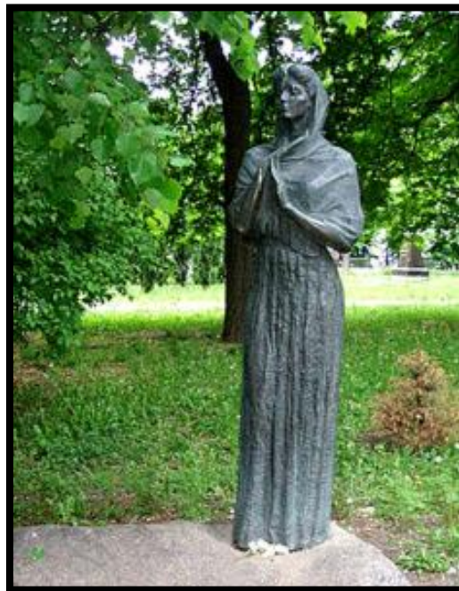
Пам'ятник Марії Костянтинівні в Марійському парку