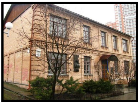
Музей Марії Заньковецької. Київ, вул. Велика Васильківська, 121.

Перлина українського театру Марія Костянтинівна Заньковецька доживала свій вік на околиці Києва, в Деміївці, по вулиці Велика Васильківська, 121. На другому поверсі маленького будиночка, у вологій і холодній квартирі було завжди чисто і багато квітів. Сюди 1923 року завітали з театру «Березіль» молоді митці В. Василько і Л. Гаккебуш. Марія Костянтинівна особисто передала їм для музею документи, афіші, фотографії, сценічні костюми. З них започаткувалась оригінальна колекція. Тут у 1960 році відчинилися двері для відвідувачів меморіальної квартири Марії Заньковецької, експозиція якої складалась зі скарбів колекції, що вже належала тоді Державному музеєві театрального, музичного і кіномистецтва України. Згодом дім української актриси був зруйнований. А 1989 року у реконструйованому приміщенні квартири № 4 знову запрацював музей Марії Заньковецької. В ньому розмістилась експозиція про життя і творчість актриси, її меморіальна квартира, театральна вітальня.