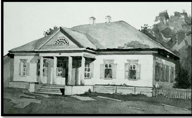
Будинок Адосовських у селі Заньки Ніжинського повіту

Розповіді старої бабусі, її пісні та приказки глибоко запали в душу вразливої дівчинки. Увесь навколишній світ став для Мані (як ласкаво її називали рідні) однією великою сценою. Наприклад, широка алея, обсаджена стрункими тополями, вела до улюбленого ставка дівчинки. Саме там, як видавалось майбутній актрисі після оповідок бабусі, що десь у місячну ніч виходять