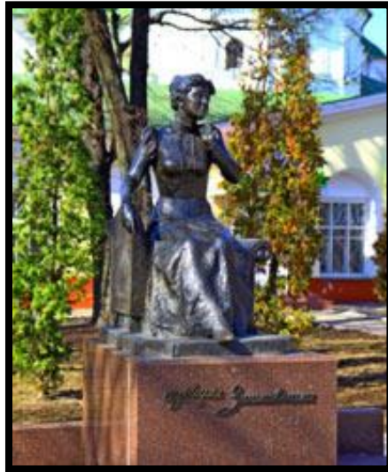
Пам'ятник актрисі біля Ніжинського музею на її честь