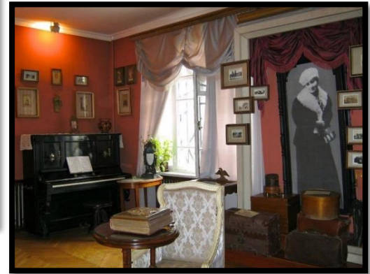
У музеї М. Заньковецької в Кисві