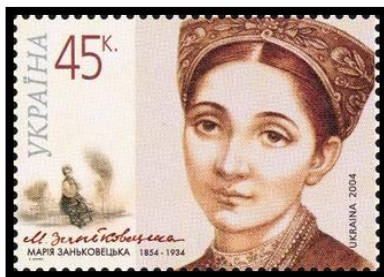
Марія Заньковецька на поштовій марці, 2004.