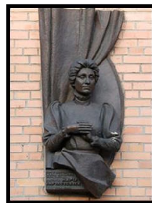
Музей М. Заньковецької в Києві. Барельєф актриси на фасаді будинку.

Експозиція музею Марії Заньковецької створена на основі великої колекції актриси, яка збиралася з 1923 року у Музеї театрального, музичного та кіномистецтва України, філіалом якого є цей музей. Більше двох тисяч найцінніших реліквій колекції – рукописів, фотографій, програм і афіш вистав, костюмів і особистих речей актриси – нині відкриті тут для відвідувачів. Площа музею 300 кв. м. Експозиція знаходиться на другому поверсі. Вона поділена на дві частини: праворуч – дві зали, які висвітлюють життя і творчість М. К. Заньковецької у 1854 – 1917 рр.; ліворуч – меморіальна квартира. У квартирі М. Заньковецької було три кімнати: кабінет, вітальня, їдальня, а також кухня. Інтер'єри цих кімнат відтворено за документальними свідченнями сучасників актриси, фотографіями і малюнками художника Ю. Павловича. В кімнатах переважно представлено меблі і речі, що належали великій артистці. Фотографії і документи, розміщені в кімнатах, дають можливість вести дальшу оповідь про життя актриси.