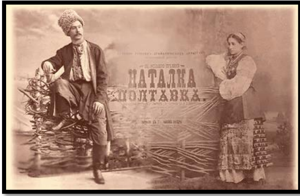
Заньковецька в ролі Наталки із "Наталки-Полтавки" І. Котляревського

театрального мистецтва. Пізніше Марія Заньковецька (вона взяла цей псевдонім на згадку про щасливе дитинство в Заньках) працювала в найпопулярніших і найпрофесійніших українських трупах М. Кропивницького, М. Старицького, М. Садовського, П. Саксаганського, І. Карпенка-Карого.