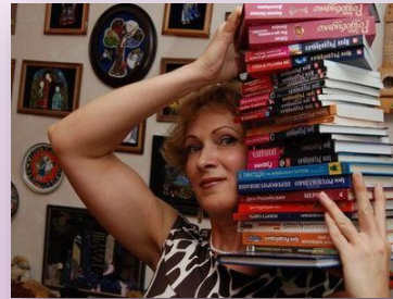
Володарка титулу «Золотий письменник України», 2018.