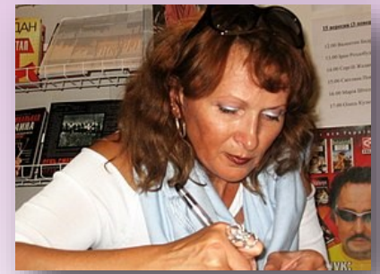
На презентації «Ювілейні скарби Коронації», 2016.