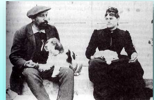
Луї Буссенар з дружиною