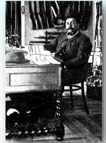
Луї Буссенар за роботою