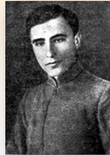
Служба в лавах Червоної Армії на посаді старшого полкового вчителя, 1924 р.