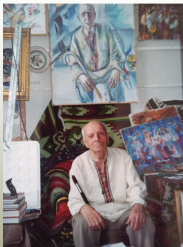
О. Я. Ющенко у своїй квартирі в Києві, 2003 рік.